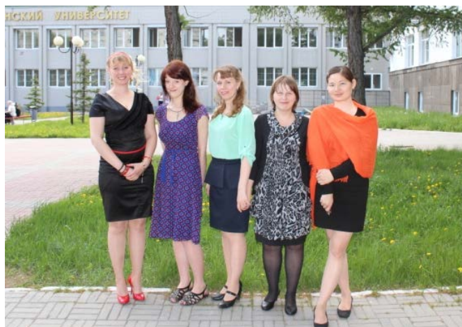
«Надежда библиотеки, или Нашего полку прибыло»