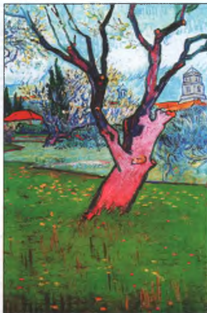
Винсент Ван Гог. Вид на Арль среди цветущих деревьев. 1889